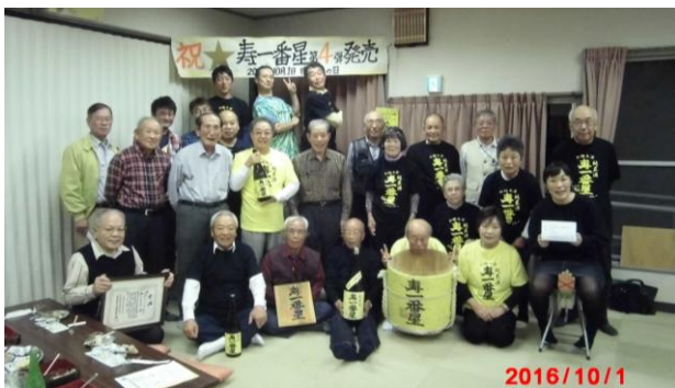
◀10/1(土)祝・発売! 清酒「寿一番星」