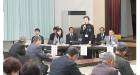
▲11/2(水)議会報告会 in 波田公民館