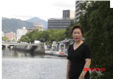
▲7/27(木)～29(金)教育民生委員 会行政視察 in 明石・岡山・ 呉・広島市 戦後70年の夏 の朝、バックに原爆ドーム