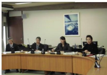
▲1/25(水)～27(金)会派「みんな の未来」行政視察 in 神戸・淡 路・南あわじ・鳴門市ほか