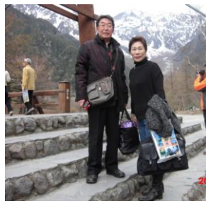
▲4/27(水)上高地開山祭 5/3(火)松本子どもまつり▶