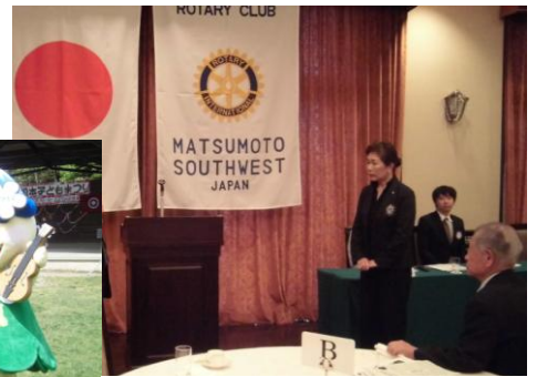
▲6/8(水)西南ロータリークラブ 「地域づくり」について講演