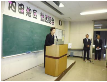
▲4/25(月) 内田地区歓送迎会