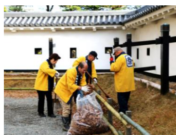
▲12/1(木)松本城年末清掃