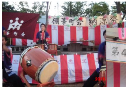
▲7/30(土)棚峯町会納涼祭 8/7(日)寿台夏祭り▶