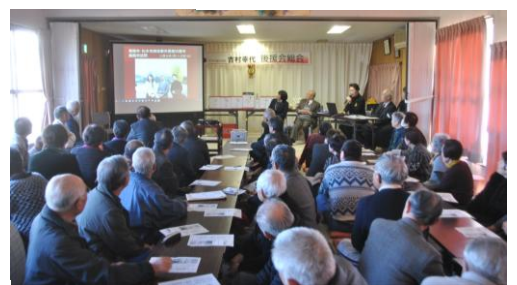
▲2/4(土)吉村後援会総会