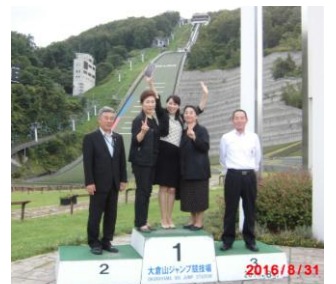
▲8/30(火)～9/1(木)会派 「みんなの未来」行政視察 in 苫小牧・札幌市