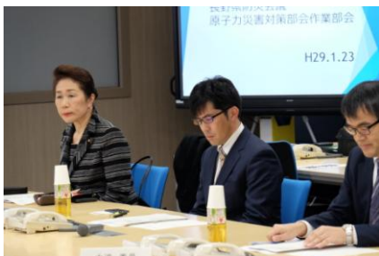
▲1/23(月)長野県防災会議 原子力災害対策部会