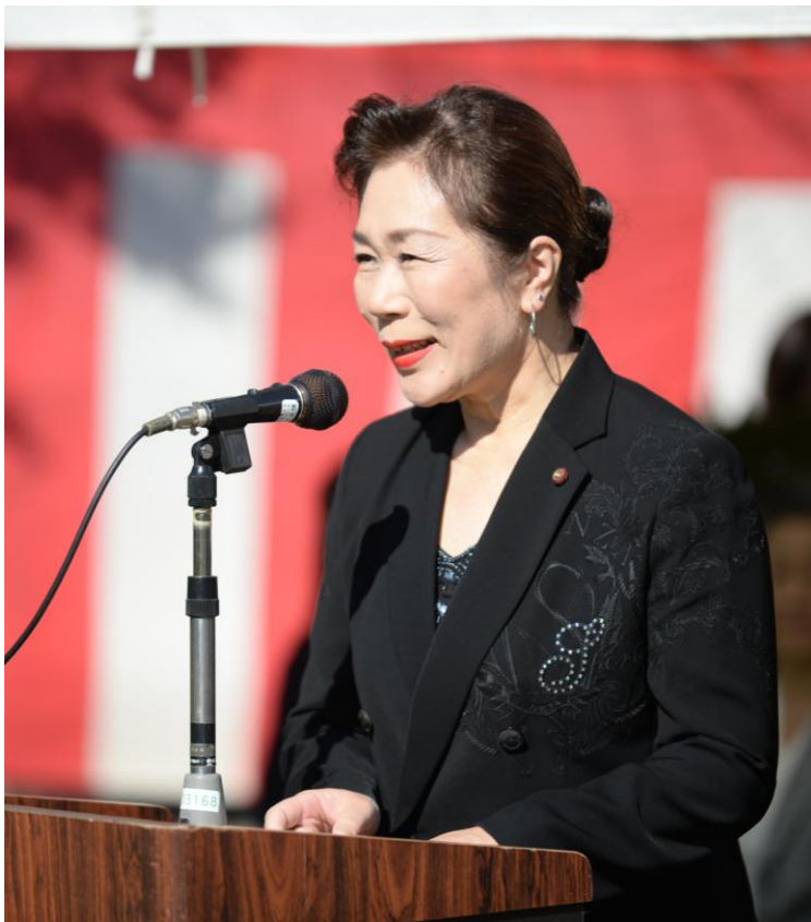
▲平成28年10月 第28回国宝松本城「古式砲術演武」松本市議会を代表して、ご挨拶を申し上げます。

さて、平成28年度6月定例会議中に、国保税の改正に関する議案が提出され、管轄の教育民生委員会審議の場になりました。国民健康保険財政は、被保険者の減少や高齢化を主な原因として医療費が伸び続ける一方で、保険料収入は減少し、非常に厳しい状況に陥っています。